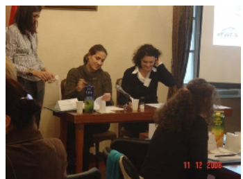
Potpisivanje Sporazuma o saradnji Kulturni centar Kotor