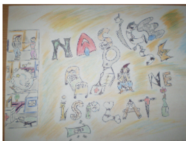
Nikola Klincov OŠ » Kecec«, Sutomore