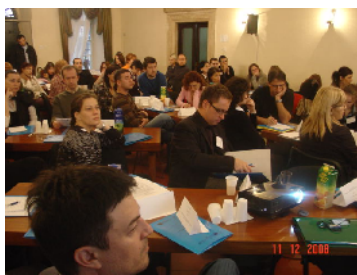
Konferencija, Opština Kotor

Forum MNE je od februara 2008. godine pridružen član ERYICA-e , Evropske agencije za informisanje i savjetovanje mladih, krovne organizacije koja okuplja preko 40 institucija i organizacija koje se bave informisanjem mladih, iz 28 evropskih zemalja. Ovim je Forum MNE uspostavio komunikaciju i saradnju sa članicama ove mreže. Sama činjenica da je u sedmici od 08-14. decembra 2008. godine na 3 događaja u Crnoj Gori radilo preko 100 predstavnika članova ERYICA-e, govori o značaju ove saradnje. Rezultati konferencije, seminara i generalne skupštine ERYICA-e značajno će unaprijediti razvoj informisanja mladih u Crnoj Gori i otvoriti dalje mogućnosti saradnje.