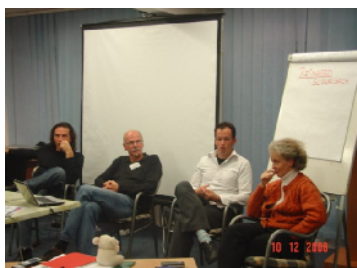
4 evropske organizacije: ERYICA, Eurodesk, Evropski omladinski forum, Savjet Evrope