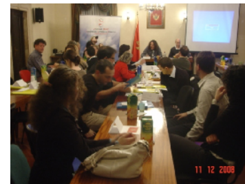
Generalna skupština ERYICA-e: Svečano otvaranje

Kratak pregled aktivnosti u oblasti informisanja mladih, koje su kroz Info resurs centar Forum MNE sprovedene od septembra 2007. godine